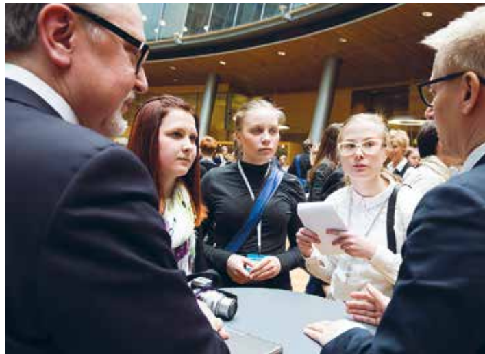
Riksdagsledamot Antero Laukkanen (kd, till vänster) och jordbruks- och miljöminister Kimmo Tiilikainen (cent) intervjuades av ungdomsparlamentets journalistelever.

Riksdagen gjorde en del förberedelser inför 100-årsjubileet med anledning av Finlands självständighet. Evenemangen inleddes med temaveckan Riksdagsledamöterna i skolan. Under jubileumsåret arrangerar riksdagen ungefär sextio nationella och internationella evenemang. Riksdagens jubileumspenium går av stapeln den 5 december 2017.