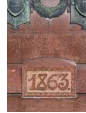
Senaatintorilla oleva Aleksanteri II -patsas on myös vuoden 1863 valtiopäivien muistomerkki.