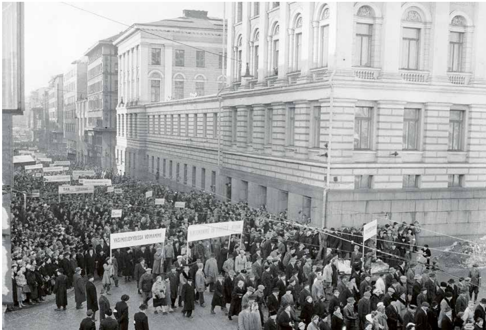
Maaliskuussa 1956 yleinen tyytymättömyys johti laajaan yleislakkoon, jonka laukaisemiseen tarvittiin uusi laajapohjainen hallitus ja merkittäviä palkankorotuksia.