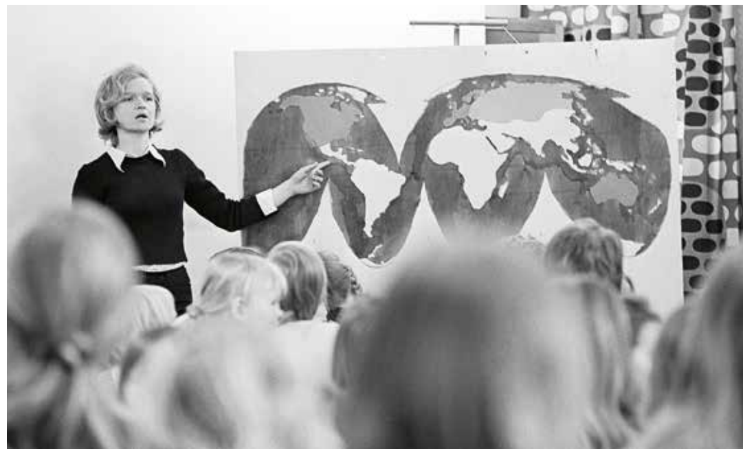
Sotien jälkeisen pohjoismaisen hyvinvointivaltion tunnusmerkki on vahva peruskoulu. Tämä kuva on 1970-luvulta.

jonka laukaisemiseen tarvittiin uusi laajapohjainen hallitus ja merkittäviä palkankorotuksia.