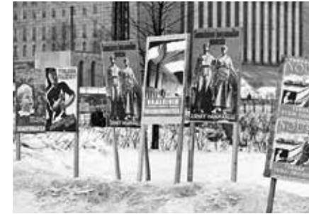
Vuoden 1945 vaaleissa äänestysikäraja laskettiin 21 vuoteen, mikä mahdollisti nuorten sotaveteraanien äänestämisen vaaleissa. Näissä vaaleissa käytettiin ensimmäisen kerran ennakköäänestystä ulkomailla, kun Ruotsiin kokonaisuudessaan evakuoitu Lapin väestö äänesti väliaikaisilla sijoituspaikkakunnillaan.

Muutokset tarvitsivat kuitenkin tuekseen pitkäjänteisiä ratkaisuja lainsäätäjiltä ja kansalaisten laajaa luottamusta maan poliittiseen järjestelmään. Vaikeimmat vaiheet koettiin vuosina 1945–48 ja 1950-luvun lopussa. Silloin monet kansalaispiirit olivat tyytymättömiä eduskunnan kykyyn tai haluun ajaa uudistuksia läpi, mikä johti ulkoparlamentaarisien joukkoliikkeitään ja toistuviin lakkoihin. Maaliskuussa 1956 tyytymättömyys johti moniviikkoiseen yleislakkoon,