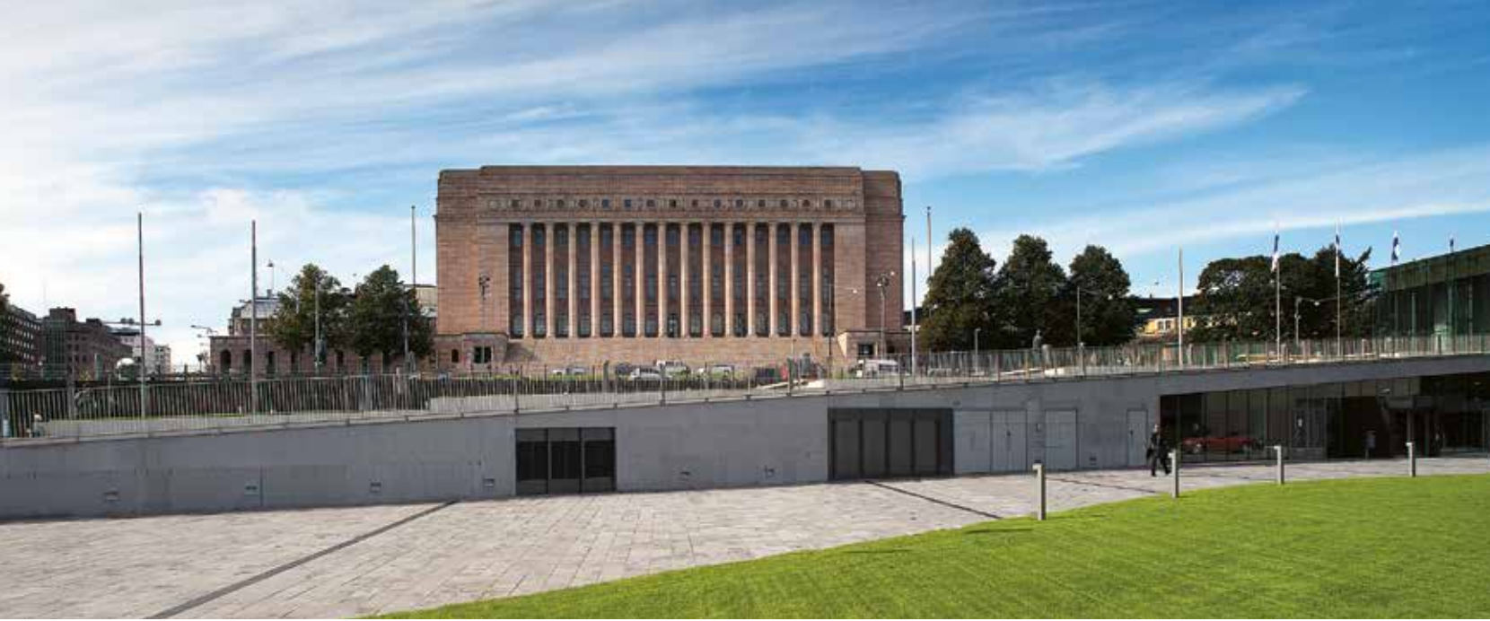
Eduskuntatalon on suunnitellut Johan Sigfrid Sirén. Se vihittiin käyttöön 7.3.1931 ja on edelleen suomalaisen itsenäisyyden ja demokratian tärkeimpiä symboleja.

ristiriitojen sovittelussa piti kunnioittaa parlamentaarisen demokratian pelisääntöjä, joihin kuului myös poliittisten kompromissien hyväksyminen. Kunnioitusta laillisesti tehtyjä päätöksiä kohtaan vaadittiin myös muulta yhteiskunnalta, ja 1930-luvun lopussa maan edustuksellinen demokratia oli selvästi osoittanut kestäväytensä laittomien ääriliikkeiden uhkien edessä. Näin suomalainen kansanvalta kesti ne paineet, jotka kaikkialla muualla Itä-Euroopassa olivat kommunismin pelossa johtaneet erilaisten oikeistodiktatuuriin syntyyn.