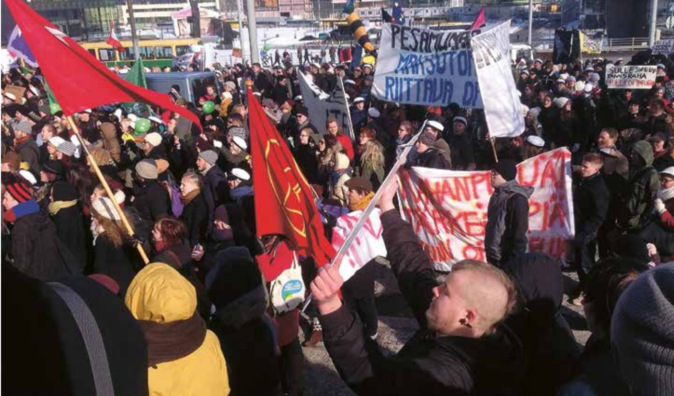
Eduskuntatalon edusta on paras paikka järjestää näkyviä ja lainsäätäjille kohdistettuja mielenilmaisuja. Tuhannet opiskelijat marssivat 20. maaliskuuta 2013 Eduskuntatalolle osoittamaan mieltään opintorahan puolesta.

EU-jäsenyys muutti eduskunnan lainsäädäntötyötä ja kansalaisyhteiskunnan toimintaa. Jokainen EU-parlamentissa säädetty, koko unionia koskeva laki täytyy hyväksyttäväksi eduskunnassa. Lisäksi ennen jokaista EU-huipputapaamista eli ministerineuvoston kokousta pääministeri käy ennakoivaa keskustelua Suomen linjasta eduskunnan suuressa valiokunnassa ja raportoi kokouksen tuloksista valiokunnalle jälkepäin. Myös muut valiokunnat osallistuvat EU-asioiden valmisteluun ja valvontaan antamalla oman toimialansa lausuntonsa suurelle valiokunnalle. EU-asioiden käsittely on merkittävästi lisännyt eduskunnan työtä.